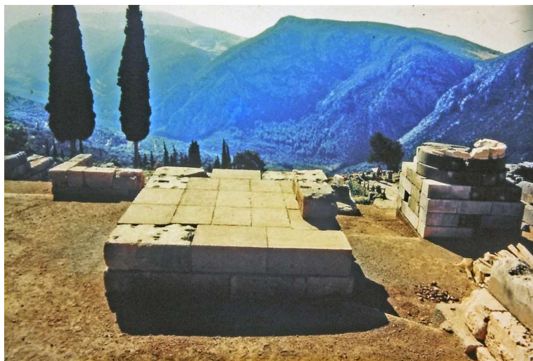
Fig. 1. Reconstruction de la fondation rhodienne (1996-98)

La proposition d'une poursuite du remontage de la base rhodienne qui émane de l'Éphorie de Delphes est un puissant stimulant pour achever l'étude et la faire déboucher sur une publication.